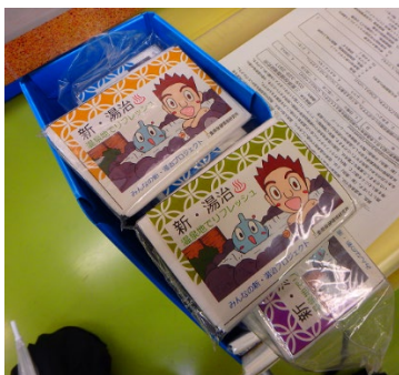
(三重県保健環境研究所)