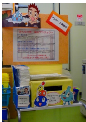
(三重県保健環境研究所)