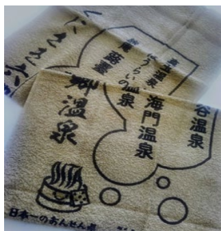
(東海大学海洋学部 くにしき六郷温泉)