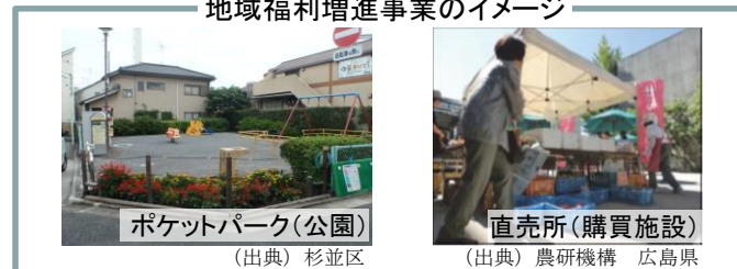
地域福利増進事業のイメージ