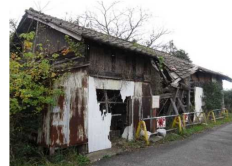
建築物のイメージ