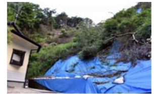
豪雨の度に土砂崩れが多発