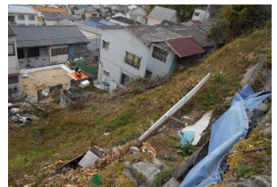
高台から瓦礫や岩石、柵等が落下するおそれ