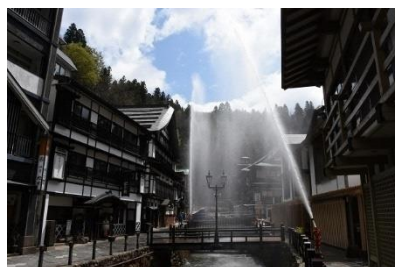
放水銃での一斉放水（訓練）

平成 30 年度から翌年にかけて、3 号源泉の増掘と揚湯機械の更新にあわせ、観光客に利用していただく屋外ステージを整備し、日帰り観光客へのサービスの向上を図った。