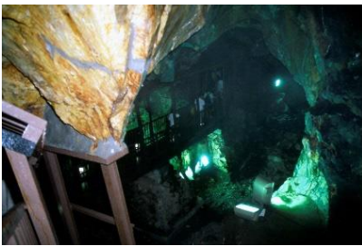
延沢銀山遺跡の内部

昭和60年12月に、温泉街の奥にある、旧鉱山跡が「延沢銀山遺跡」として国の史跡に指定された。銀鉱山としては、島根県の石見銀山遺跡に次いで全国で2番目の指定となった。