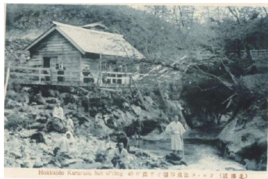
古くから湯治客などで賑わうカルルス温泉