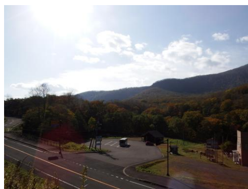
カルルス温泉駐車場