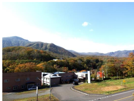
カルルス温泉入口