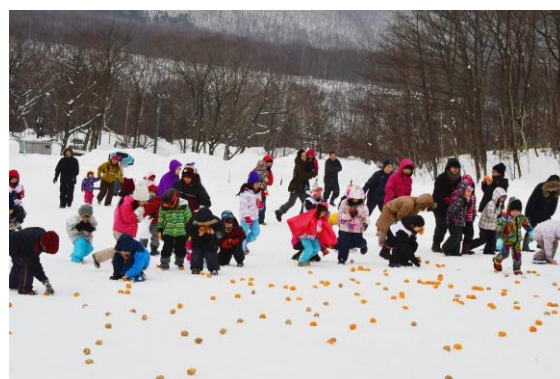
カルルス温泉冬まつり