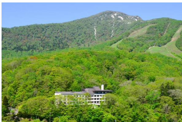
旅館の背景に広がる来馬岳

現在のカルルス温泉には、4 軒の宿泊施設があり、今では少なくなった日本の古き良き温泉地の雰囲気が多く、多くの観光客を惹きつけている。