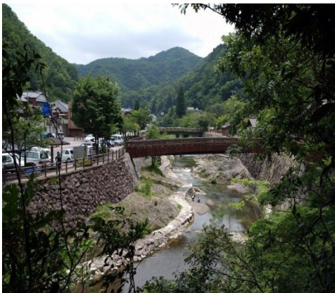
香東川（こうとうがわ）流域の風景

今日では、塩江温泉郷を貫流する香東川流域で、春にはソメイヨシノに囲まれる中で「桜まつり」が、初夏にはゲンジボタルが乱舞する中で「ホタルまつり」が、秋には色鮮やかな美しい紅葉が鑑賞できる「もみじまつり」が開催され、自然が織りなす四季折々の風情に合わせたイベントを実施することで、大自然と湯治を十二分に味わえる温泉郷として、地元の方のみならず、県外・国外からの観光客の方々にも親しまれている。