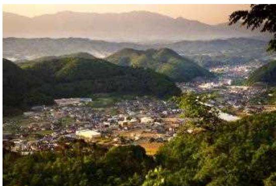
【大山展望台から臨む湯郷温泉】

湯郷温泉の歴史は古く、奈良時代には塩湯郷の地名で知られており、開湯は1200年以上の昔、平安時代、延暦寺の慈覚大師円仁法師が、湯郷の地で水浴びをして傷を治す鷲を発見したという逸話から始まる。百人一首の選者である藤原定家も療養のために湯郷温泉を訪れたかったが、「遠方の為有馬温泉で我慢をするか」と書いている。開湯の逸話からもわかるように、湯郷温泉は療養湯であり、江戸末期には湯治客で賑わっており、湯郷村の80軒のうち76軒が湯治関連を生業としていた。