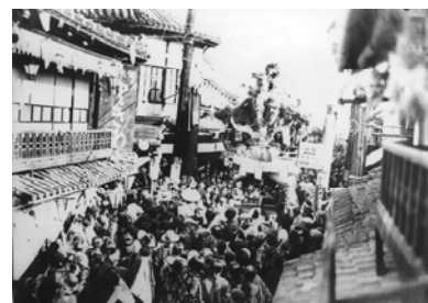
昭和のころの湯郷温泉

京阪神からのアクセスの良さから、昔日は歓楽街として賑わいをみせていたが、時代の流れとともに衰退し、新たな街づくりとしてスポーツとの関わりを前面に押し出し、合宿の誘致等に力を入れ始めた。