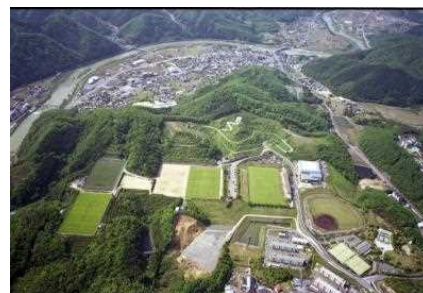
美作市総合運動公園

湯郷温泉において泉質と同様に特筆すべきなのは、スポーツとの関わりである。湯郷温泉を有する美作市内には女子サッカー日本代表を輩出した岡山湯郷 Belle を始め、世界的な知名度を持つ宮本武蔵の生誕地、F1も開催された岡山国際サーキット、トレッキングにも適した県下最高峰の後山・日名倉山、少林寺拳法の開祖である宗道臣生家、市内に点在する4つのゴルフ場など、数多くのスポーツ拠点が存在する。このように湯郷温泉はスポーツとの関わりが非常に強い。