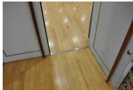
湯郷地域交流センターのバリアフリー