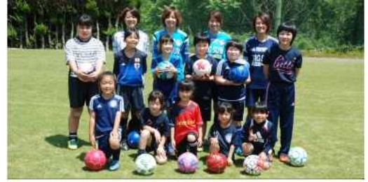
岡山湯郷 Belle によるサッカースクール

近年、女性・高齢者・外国人旅行者のヘルス・ツーリズムに対する関心が高まっており、そこで湯郷温泉の泉質が療養湯であること、スポーツとの連携が容易であることから、湯郷温泉では温泉とスポーツの二つの側面から健康を増進していく。