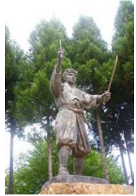
青年期宮本武蔵像

また、美作市は宮本武蔵の生誕地の一つであり、市内を通っている旧出雲街道の宿場町、「土居宿」、旧因幡街道の「大原宿」などが存在し、特に大原宿の古町地区は岡山県の町並み保存地区に指定されているなど歴史的資源が豊富である。