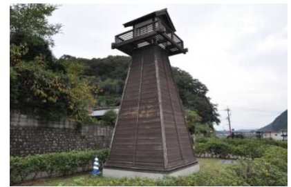
温泉地内の常夜灯

近年は、おもちゃの町や工芸の町などの多面的な盛り上がりを見せており、特に工芸については移住者の若手ガラス作家による空き店舗利用により、ガラス等の手作り工芸が盛り上がりを見せている。