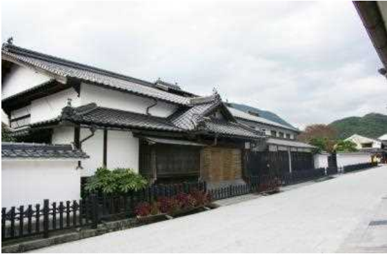
旧因幡街道大原宿

また、湯郷温泉には、おもちゃ三館と呼ばれる「あの日のおもちゃ箱 昭和館」、「てつどう模型館&レトロおもちゃ館」、「現代玩具博物館・オルゴール夢館」など、古今東西のおもちゃを扱う3ヶ所の観光施設があり、平成21年には、新たな町おこしとして3世代で楽しめる「おもちゃの街宣言」をしており、おもちゃの町の側面もある。さらに湯郷温泉には吹きガラスなどが体験できる5つの工房を抱えているように、工芸の町といった側面もある。