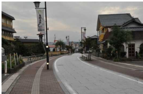
無電柱化・景観舗装