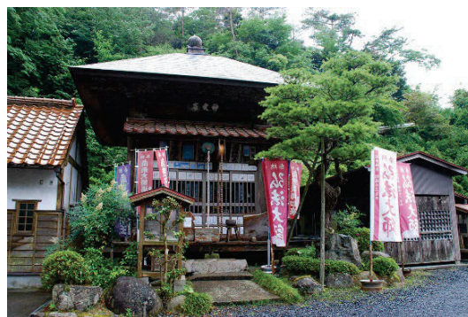
関金の温泉街にある「地藏院」

国鉄倉吉線は昭和 33 年（1958 年）に山守まで延伸されたが、昭和 60 年（1985 年）に全線廃止となった。加えて高速道路網や公共交通網の発達の遅れによる交通の利便性の低下等により、平成 15 年（2003 年）を境に入湯客が減少に転じた。また、景気の低迷も重なり、民間の宿泊施設が廃業する中、令和 2 年（2020 年）の新型コロナウイルス感染症の急速な感染拡大の影響等により、同年 3 月、関金温泉を代表する宿泊施設であった旧国民宿舎も閉