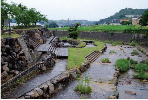
滝川に整備された「滝川親水公園」