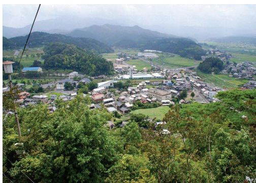
亀井公園から望む関金の温泉街

順調に湯治場として機能してきた関金温泉では、数軒の宿泊施設と共同浴場は独自の源泉を有していた。旧関金町では、関金温泉のさらなる発展を検討して昭和 38 年（1963 年）から新規の温泉掘削に着手する。複数の温泉掘削に成功し、昭和 44 年（1969 年）から集中管理による温泉の配湯を実施した。旧来の温泉街は山あいでも平地が少なく地形の関係上新たな開発ができないため、温泉街の外側を開発して公営の国民宿舎および簡易宿所を設置した。また、民間の宿泊施設や温泉を利用した老人福祉施設の新規参入もあって温泉街が広がった。