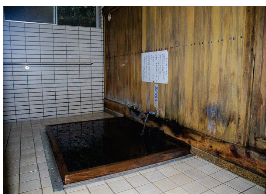
共同浴場「関の湯」の浴槽

関金総合運動公園においては、令和3年（2021年）9月に全面天然芝のラグビー場を整備し、更なる機能強化を図っており、「HOTEL 星取テラスせきがね」を活用したスポーツ合宿での利用も多く見込んでいる。