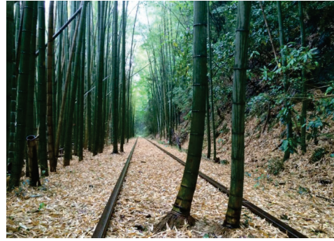
竹林に囲まれた国鉄倉吉線の廃線跡

関金温泉の民族的伝統行事としては、「関金御幸行列」が挙げられる。毎年9月に開催される祭典で、湯関神社、大鳥居神社、日吉神社の3社による大名行列を模した行列で、倉吉市の無形民俗文化財に指定されている。