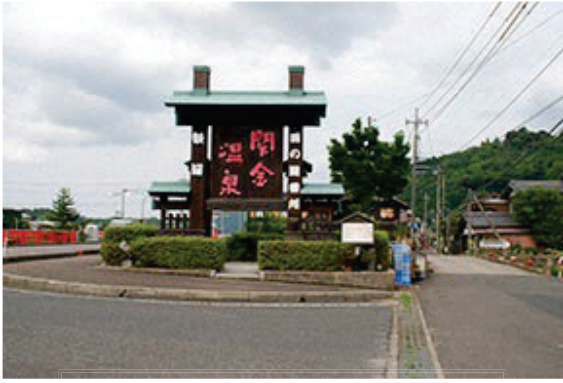
美作街道番所(関所)後

も見られる。また、明治43年（1910年）に発行された「日本名所事彙」には「古へは湯の關と稱（しょう）せり」という記述があり、関所（番所）のある宿場に温泉が湧いていたことが分かる。