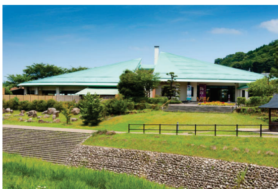
湯中運動が実施される「湯命館」