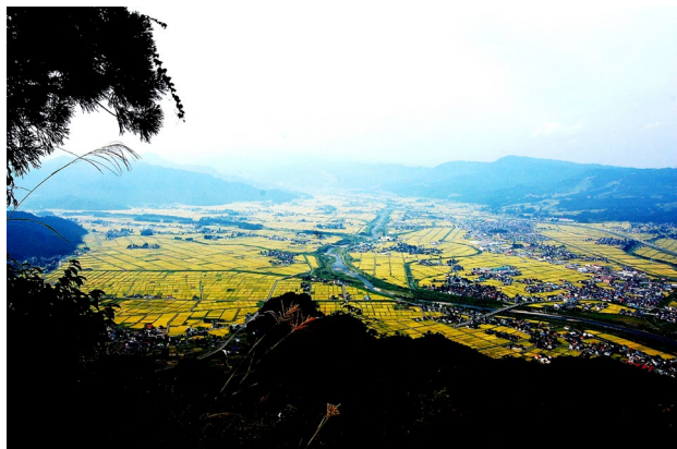
▲夏の南魚沼の田園風景

六日町温泉は坂戸城（坂戸山）の麓に位置することもあり、多くの観光客に温泉も親しんでもらっている。坂戸山は以前から地元民の朝晩の登山やトレッキングに親しまれていたが、近年では全国から登山客が訪れている。登山後の温泉利用を促進し、更に温泉の魅力が少しでも伝えようと温泉街周辺に無料の足湯を設置し、坂戸山遊歩道の整備、公衆トイレの整備、上田長尾氏史跡公園整備を実施してきた。六日町温泉は、六日町の観光資源とともに成長を遂げてきた。