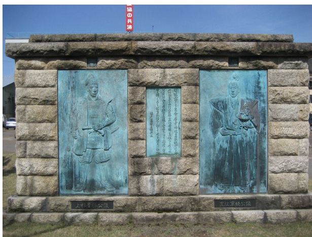
▲上杉景勝、直江兼続レリーフ

また、豪雪地である南魚沼地域で受け継がれてきた文化に織物がある。その昔、一年の半分近くを雪に覆われ、農作業はもちろん、家の外に出るのにも苦勞するほどの雪に囲まれた中、女性たちは春が来るまでひたすら布を織り続けたという様子が江戸時代の文人・鈴木牧之の著『北越雪譜』に記載されている。その中でも、通気性に富み、さらりとした着味で夏物着尺としては最高級の麻織物である「越後上布」は染織部門では日本で初めてユネスコ無形文化遺産に登録され、日本のみならず世界から評価されることとなった。