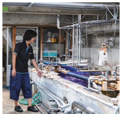
展示水槽の裏側にあるバックヤード。 ウミガメなどさまざまな生き物の飼育も行う。

当時の館長さんにも「女性はいらない」と言われましたが、ほかの職員さんが「これからの時代は女性の視点も大事だ」「体力もあるから大丈夫」と後押ししてくれたんです。大学のゼミの先生も館長さんを説得してくれました。当時はね、やっぱり女性を入れてもすぐに結婚して辞めてしまうこともあるし、こういう仕事は特殊じゃないですか。長く続けたいと経験が身につかないことがあるので、そういう意味では