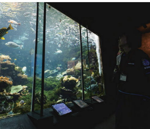
水族館の生物は飼育員や地元の漁師さんなどが串本で採取。

私、子供のときに溺れた経験があって、ちょっと水恐怖症なところがあったんですよ。ただ、ここで働くには海での潜水訓練をクリアしないといけない。初めて海に深く潜ったときは、最初はちょっと怖くなって水の中でパニックになりかけたんですよ。必死に我慢してましたが、一緒に潜っていた上司に気付かれて「上がれ」と言われて……そのときはすごく落ち込んだりもしましたね。でもそこから潜れるようになって、なんとか35年続けてこられました。