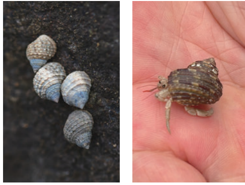
左・アラレタマキビ（会のシンボル） 右・オカヤドカリ（天然記念物） 天神崎の生物。熱帯～亜熱帯に分布するオカヤドカリは幼生が黒潮に乗って運ばれてくる。

5月末には遊びがてら桜の木の下くらんぼをとって食べて、口を紫にして親に怒られたりね。6月にはヤマモモで、同じく怒られ。秋には椎の実を炒って食べて、中学生ぐらい