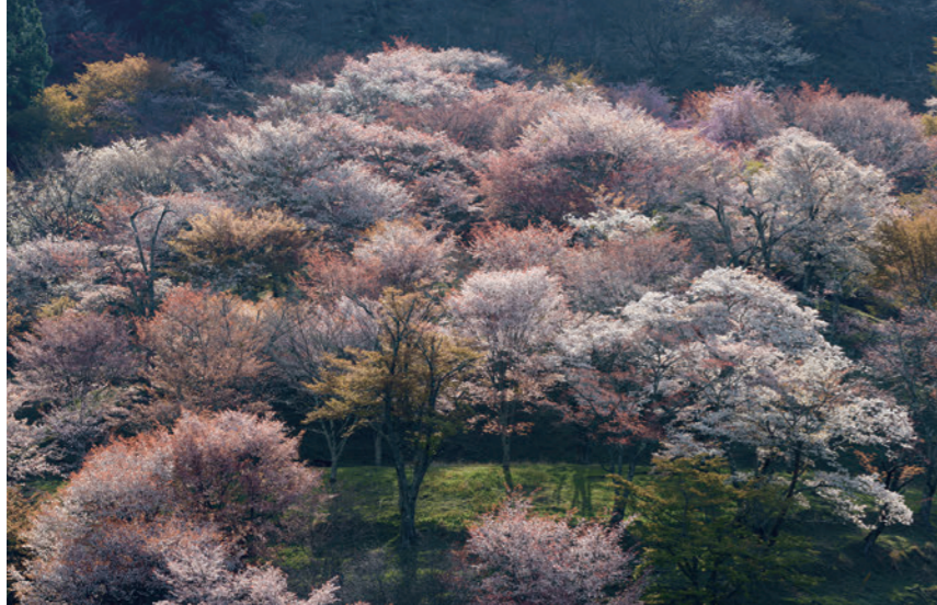
山桜が咲くと、赤茶色、白、薄ピンク…さまざまな色が混ざり合う。