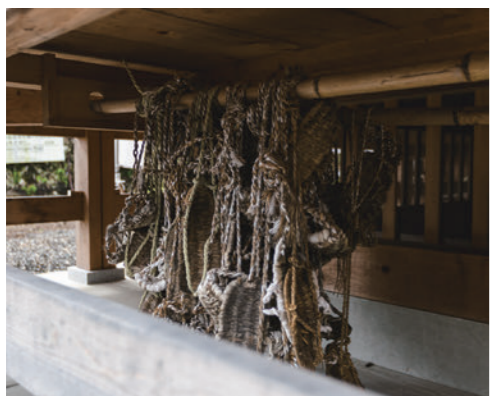
2023年に再建された行者堂の床下には、大峯奥駈修行に使った草履が吊るされていた。