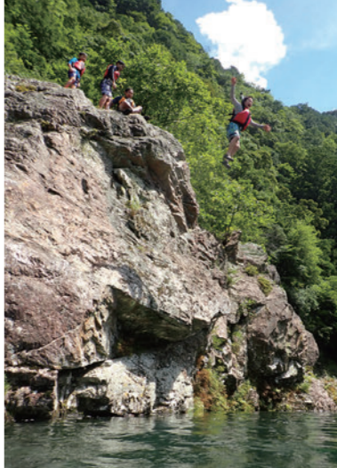
大杉谷自然学校が主催する子供向けプログラム。川遊びや飛び込みなど、大杉谷の自然を体感。

でどういことや」という地域の声もあったと思うんですね。それで廃校後も変わらずに子供たちの声が聞こえるような場所にしていきましようということ、自然学校が選ばれたんだと思います。2001年3月までは北海道で養成講座を受け、2001年4月にこの場所で自然学校を開校しました。トントン拍子といえ、本当にトントン拍子ですよ。