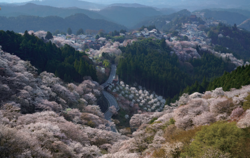
山桜に彩られた春の吉野山。