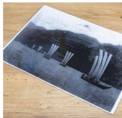
体感塾には、三反帆が生活に欠かせなかった時代の写真が保管されている。

渡し舟の運賃は、住民はタダだったり、5円、10円の時もあったね。今でいうと、パン1個ぐらいの値段やっただね。一艘でいたい10人くらい乗れる。団体さんなんか来たらすごいお金になるときもありました。朝から夕方まで渡し場待って、人が見えたら迎えに行く。冬の寒かったときはえらかったね。渡守が待機する小屋もあってね、そこで火を焚いて暖をとった。私は紀宝町の製紙会社に就職したんですけど、当時は汽車通勤の人も結構いて、新宮駅で降りてから池田の渡しで川を渡って、会社に行く人もいたね。