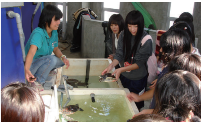
水族館の体験プログラムにて。串本の海の生き物に直接触れて生態を学ぶ。

生き物もいるので、魚の種類が多い。生き物の多様性が高いって言われていますね。日本近海の魚はだいたい4000種くらい確認されているんですけど、そのうち4分の1は串本で見ることが出来ます。