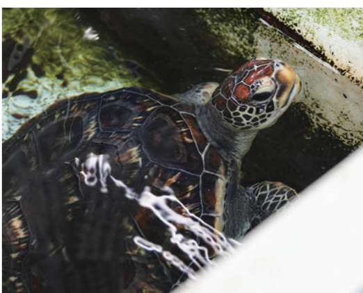
アカウミガメ、アオウミガメは水族館の目玉の一つ。

水族館の目の前には素晴らしいワールドがあります。日本全国、水族館と名のつくところ