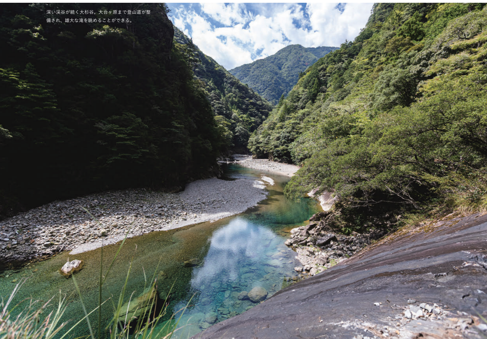
深い溪谷が続く大杉谷。大台ヶ原まで登山道が整備され、雄大な滝を眺めることができる。

それがどうしてわかるかっていうと、たとえば私たちは淡水魚のネコギギの調査を継続していますが、実は、災害を挟んでネコギギの個体数はV字回復しているんです。熊野で大災害があった2011年も個体数はV字回復しました。災害によって河川が大きく攪乱されると空間ができます。その空間に隠れたり、そこにいるものを食べたりと、多様性のある豊かな環境が生まれるんです。ですが、攪乱がなくなると、隠れ家もない、餌もない状態に陥ってしまうということなんです。ネコギギは災害に強い。いやむしろ災害が好きとも言える。災害がないと増えないんです。