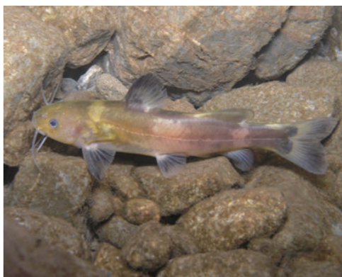
国の天然記念物に指定されている淡水魚、ネコギギ。

2004年に宮川で豪雨災害があったんです。この地域も死者・行方不明者が7名いて私の同級生の家族も亡くされました。今こそ豪雨災害は珍しくないと思うんですけど、当時はいろんな研究者の方が入ってきてね。地域の方もこんな大災害は見たことがないと。私も本当になんでこんなことが起こったんだろうと思っただんです。土石流や山腹崩壊が起きたのは植林が原因なんじゃないかとも言われました。けれど、いろいろと調べていくと、このV字渓谷を形成してきたのは、太古から繰り返されてきた災害の力なんです。災害によって崩れ続けて、そして大杉谷っていう谷が生まれてきたんですよ。人間って寿命がせいぜい100年しかない