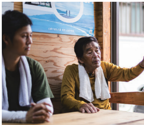
ちょうど50歳差の二人。協力し合い、体感塾を続けている。

協力隊も任期が終わったので、これからは体感塾の運営を中心に行っています。ここに残ろうと思った理由ですか？ さすがに協力隊が終わってすぐ帰る気にはならなかったです。やっぱり川舟文化の継承は3年やそこらでできるようなものではまったくないので、これどうやうスタート地点に立ったというくらいのものでしょうか。こういう取材のときに谷上さんのそばで話を聞いて、できるだけ地域の歴史や文化を蓄積して、お客さんにも伝えていきたいと思っています。