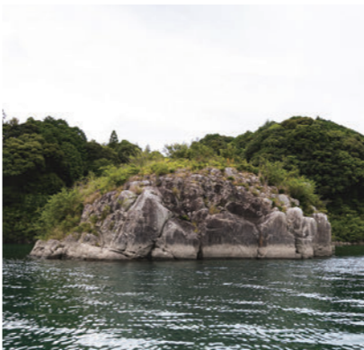
熊野川に浮かぶ御船島。熊野速玉大社の例大祭、御船祭の祭礼の場でもある。

ないと安定して走らないんです。川の流力が激しくても操舵できるように反り上がった形にしないといけない。最初に作った舟は自分ではあまり気に入ってなかったけど、何年も乗りましたよ。