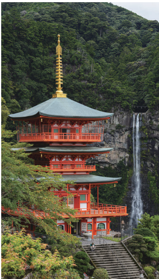
青岸渡寺の三重塔と、一段滝では日本一の落差を誇る那智の滝。

1992年には、途絶えていた那智四十八滝回峰行という修行も再興しました。毎年1月の小寒から大寒にかけて、修験者で四十八滝を回る寒行です。非常に寒いときですわ。そのときに50分ぐらい滝の水に浸かってね、もう寒いどころではない。痛いというか、だんだんその感覚もなくなると、無感覚というか、水が体の中を通るような感じになるんです。水から上がったときはもう、非常に怖い。ガタガタ震えて、