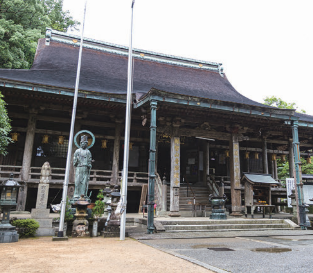
那智山青岸渡寺の本堂。

私は高校、大学と7年間この地を離れて、また戻ってきたのですが、戻ってから那智勝浦町の町史編纂委員会という歴史を研究する会に入られました。そこで修験道を研究されていた郷土史家の先生に、この地が修験道の霊場で、特に日本第一霊験所として修験者の根本道場であったゆうことを教えられてね。それで修験に関わる知識を授けていただいたんです。