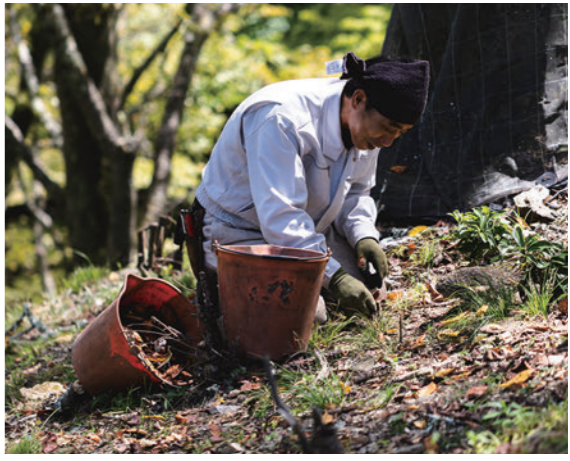
夏場の作業。桜が育ちやすい環境を作るため土壌に手を入れる。