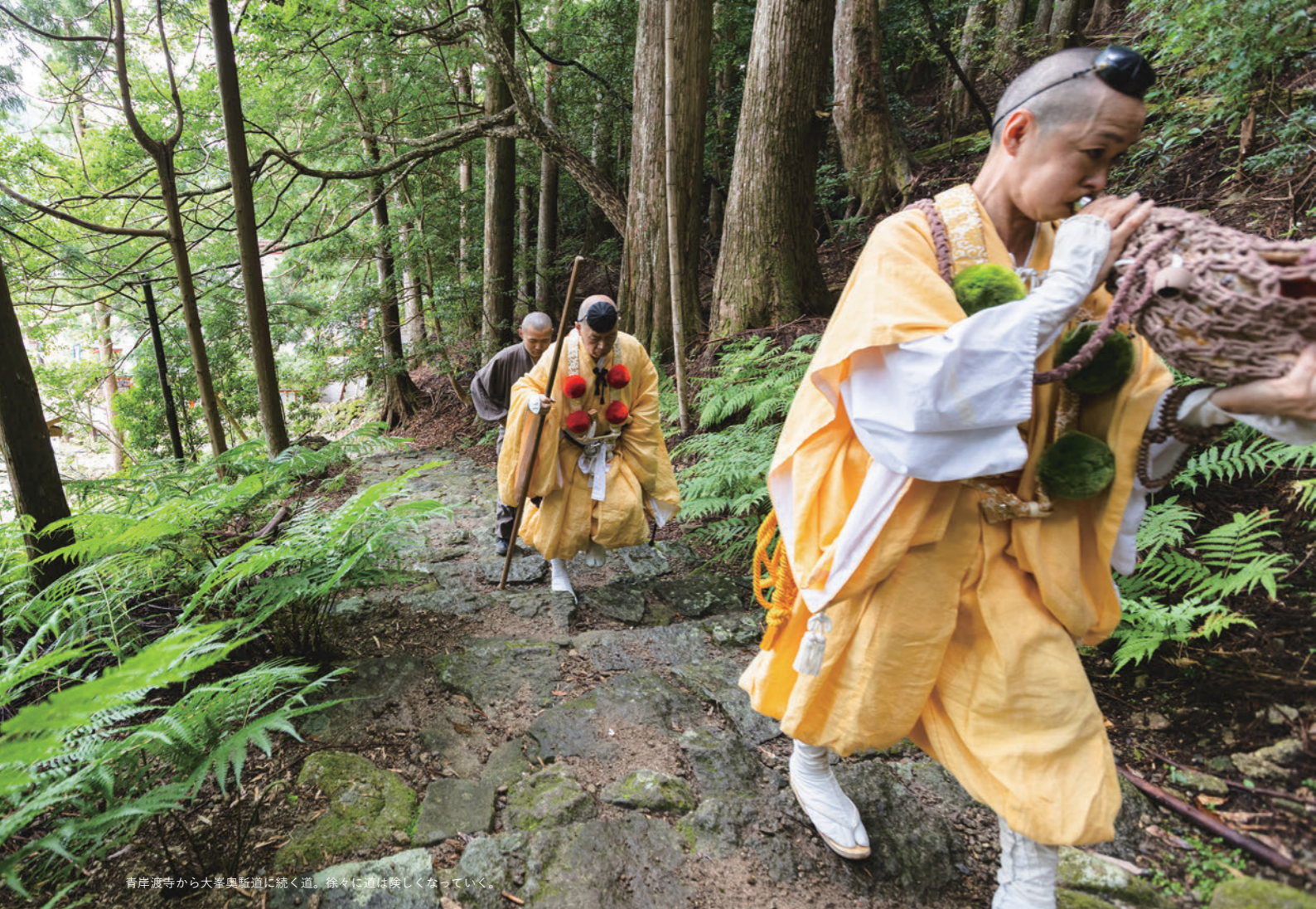
青岸渡寺から大峯奥駈道に続く道。徐々に道は険しくなっていく。

修験道の原点である自然が、国立公園として法によって守られている。それはまた非常にありがたいことです。吉野熊野国立公園は90年を迎え、また100年、200年、1000年とね、守っていくのが我々の義務というか、務めかと思っています。