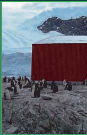
図1 避難小屋は、海岸より若干高さがあり、営巣中のペンギンが周囲を囲んでいる事も多い。