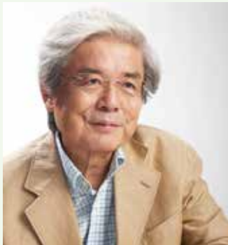
養老孟司 ようろう たけし

東京大学名誉教授。NPO 法人「日本に健全な森をつくり直す委員会」委員長。環境省「森里川海大好き！読本編集委員会」委員長、農林水産省「オーライ！ニッポン会議」代表。