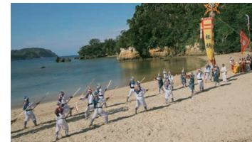
Tanadui Festival (Taketomijima Island)