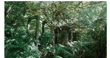
Utara Coal Mine