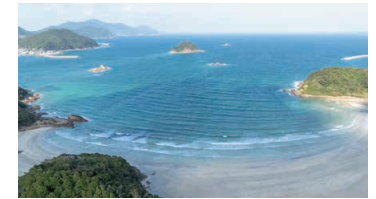
Hamaguri-hama Swimming Beach