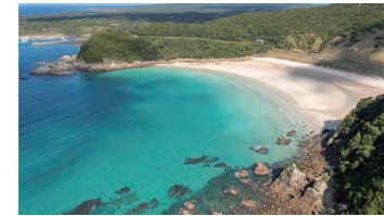
Takahama Swimming Beach