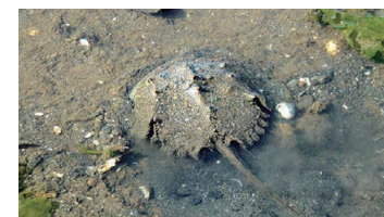
Japanese Horseshoe Crab