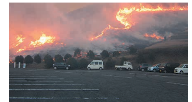
Controlled Burns of the Fields of Mt. Onidake