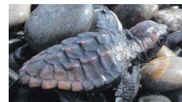
A Newly Hatched Loggerhead Turtle