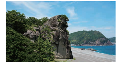
Shishiwa (Lion Rock)