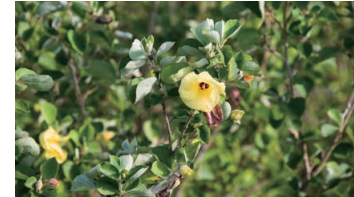
Hamabo (Hibiscus hamabo)