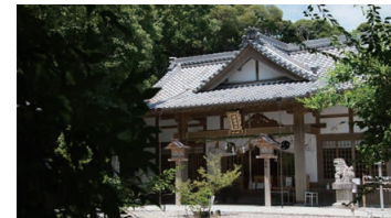
Shinmei Jinja shrine