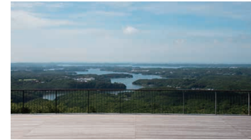
Yokoyama View Point