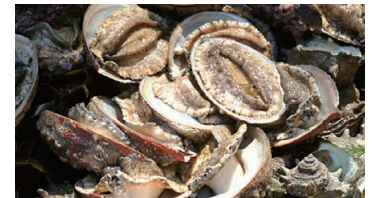
Seafood such as abalone