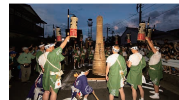
Mt. Fuji Festival