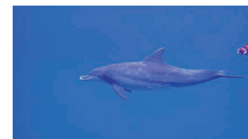
Indo-Pacific bottlenose dolphin