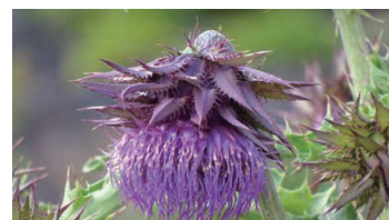
Mount Fuji Thistle