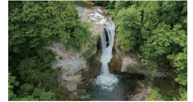
Okushiga Valley Waterfalls