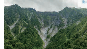
Ichinokurasawa of Mt. Tanigawa