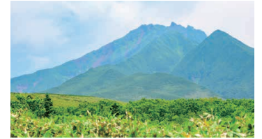
Mikaeridai Picnic Site