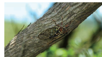
Kyushu-Yezo Cicada (the family Lyristes japonicus)