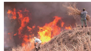
Controlled Burns (in spring)