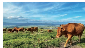
Akaushi (Japanese Brown Cattle)