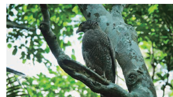
Crested Serpent Eagle