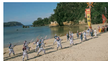
Tanadui Festival (Taketomijima Island)