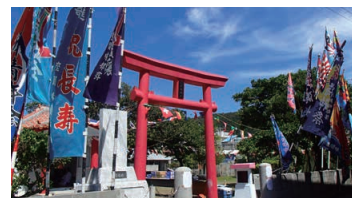
The Festival of Sea God in the Zamami Village