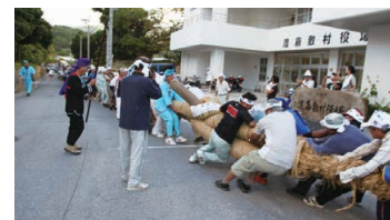
The Gaiant Tug-of-War Festival in the Tokashiki Village