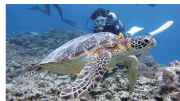
Green Sea Turtles