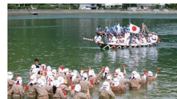
Ungami of Shioya Bay