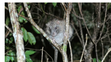
Ryukyu Long-haired Rat