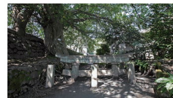
Kurokami Buried Shrine Gate