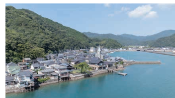
Bell View Park of chapel with a view of church