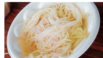
Shimabara Somen Noodles