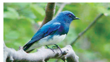
Blue-and-white Flycatcher (Cyanoptila cyanomelana)