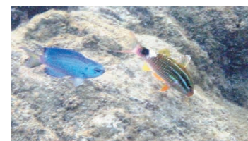
Spphire Devil Damselfish and Blacksaddle Goatfish