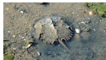
Japanese Horseshoe Crab