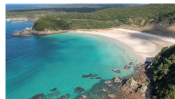
Takahama Swimming Beach