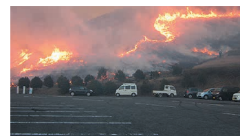
Controlled Burns of the Fields of Mt. Onidake