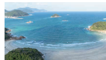
Hamaguri-hama Swimming Beach