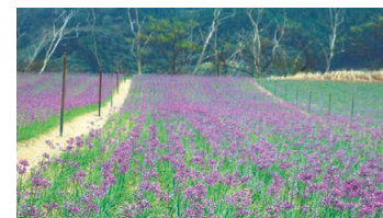
Rakkyo (Allium Chinsese) Field