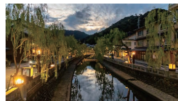
Kinosaki Onsen Shrine