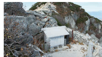
Near the Summit of Mt. Kai-Komagatake (Main Shrine of Komagatake-Jinja)