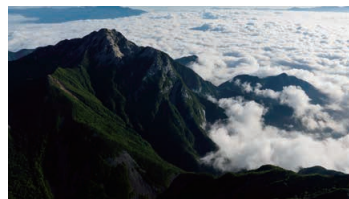
Mt. Kai-komagatake (Mt. Higashi-komagatake)