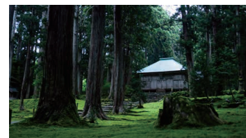
Heisenji Hakusan-jinja Shrine