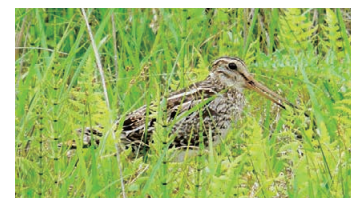
Japanese snipe (Wild Bird of Wetlands)