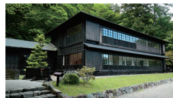
British Embassy Villa Memorial Park