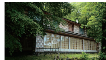
Italian Embassy Villa Memorial Park