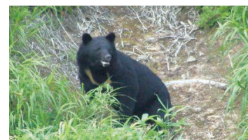
"Tsukinowaguma(Moon-ring Bear)" Asian Black Bear