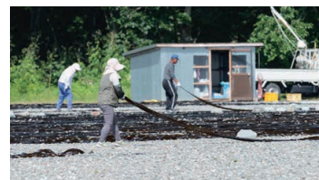
The Process of Drying Kelp