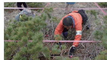
Experimental Deforestation of Dwarf Pine for Alpine Plant Restoration