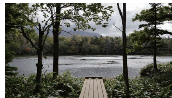
Shiretoko Goko Lakes