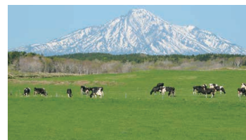
Dairy Farming of Sarobetsu-genya