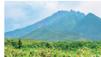
Mikaeridai Picnic Site