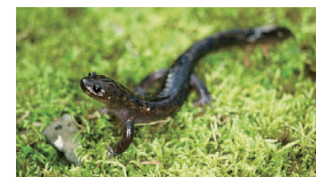
オキサンショウウオ