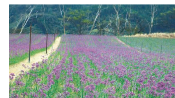
らっきょうの花畑