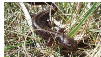
キタサンショウウオ