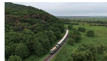
くしろ湿原ノロッコ号