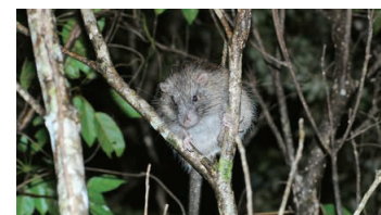
Ryukyu Long-haired Rat