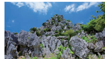
ASMUI Spiritual Hikes