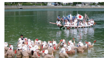
Ungami of Shioya Bay