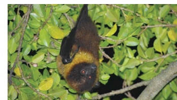
Pteropus dasymallus dasymallus