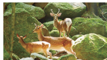
Cervus nippon yakushimae