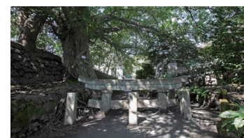
Kurokami Buried Shrine Gate