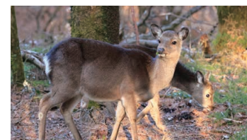
Deer (Ebino Plateau)