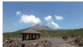
Arimura Lava Observatory