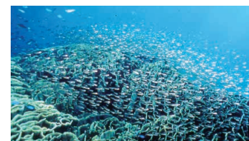
Colorful Underwater Scenery