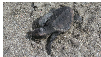
Green Sea Turtle