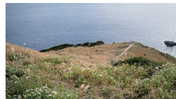
Chrysanthemum japonense (Cape Komo)