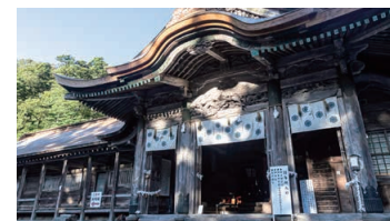
Ogamiyama-jinja Shrine Okunomiya