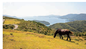
Horses and cows in Oki