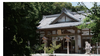
Shinmei Jinja shrine