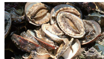
Seafood such as abalone