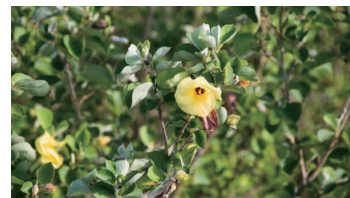
Hamabo (Hibiscus hamabo)