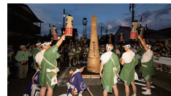
Mt. Fuji Festival