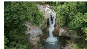
Okushiga Valley Waterfalls