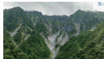
Ichinokurasawa of Mt. Tanigawa