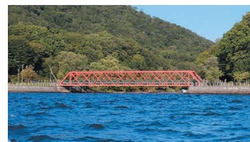
Yamasen Steel Bridge