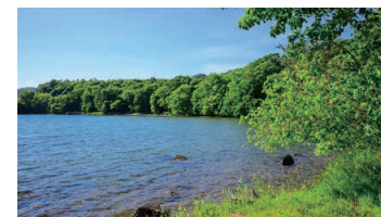
Takarada Nature Observation Trail Waterfront Forest Lane