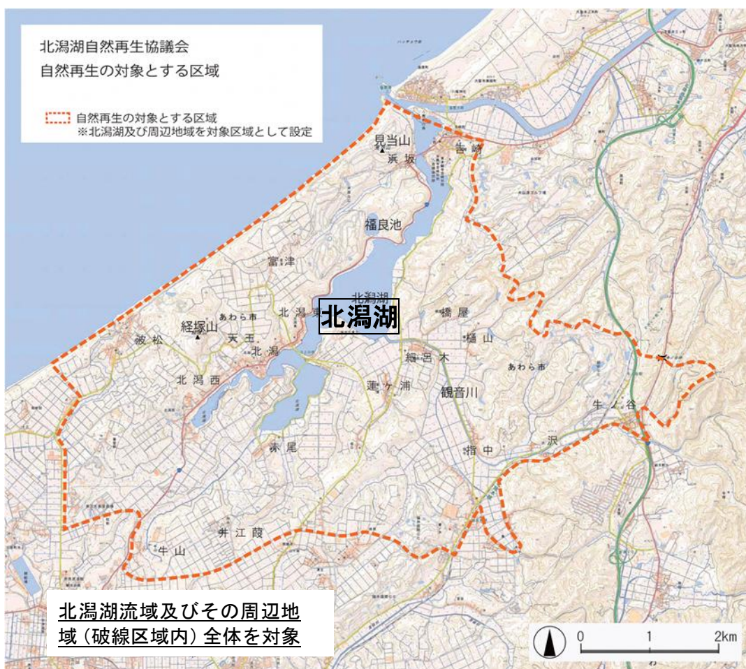
環境教育（学習）の推進事業実施位置