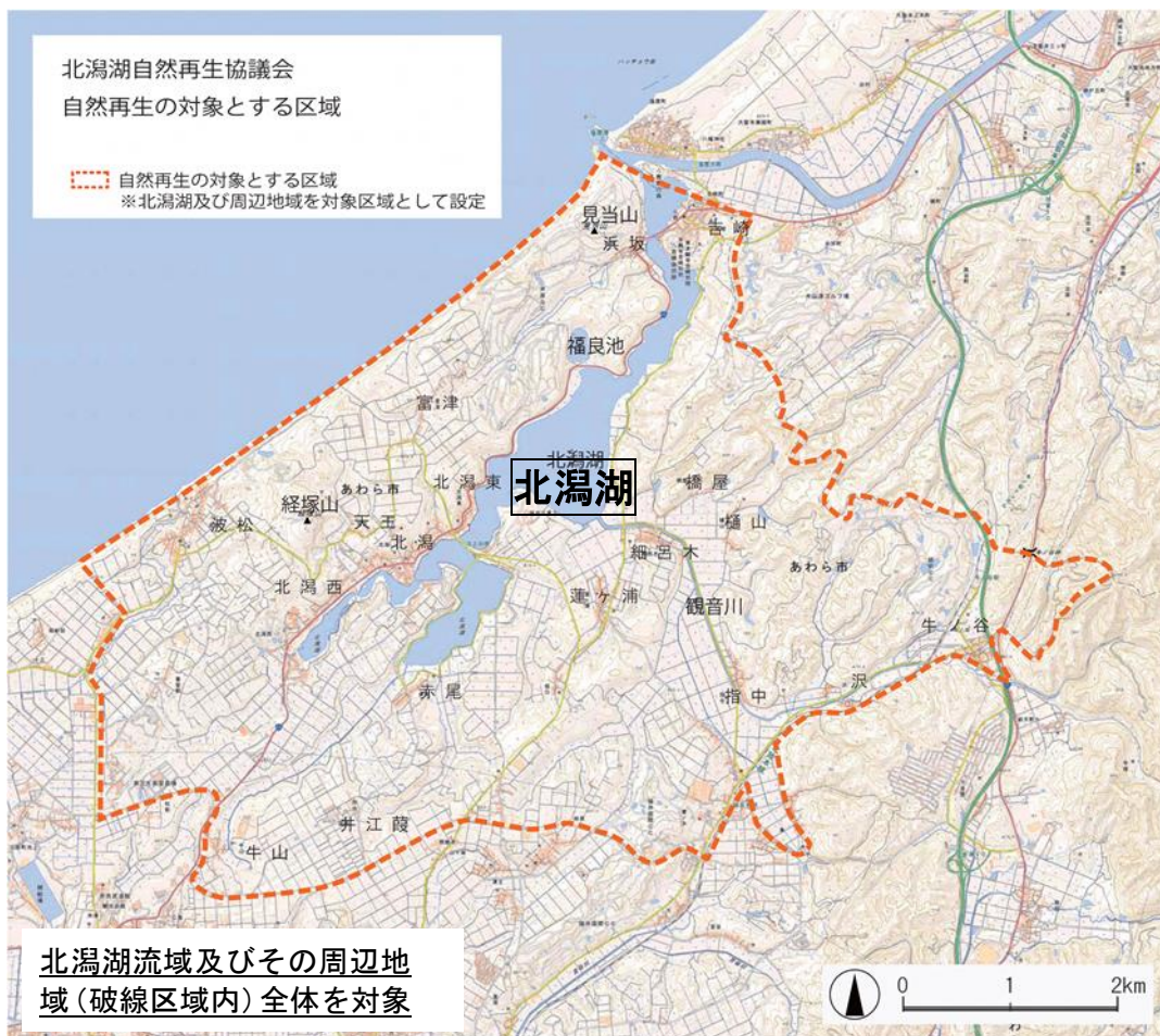
湖の伝統文化・産業の保全・再生事業実施位置