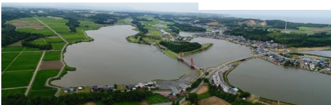
空から見た北潟湖（北潟湖中心付近より上流側を望む）

北潟湖流域及びその周辺地域（北潟湖の集水域や、地域のつながりなどを考慮しながら設定）