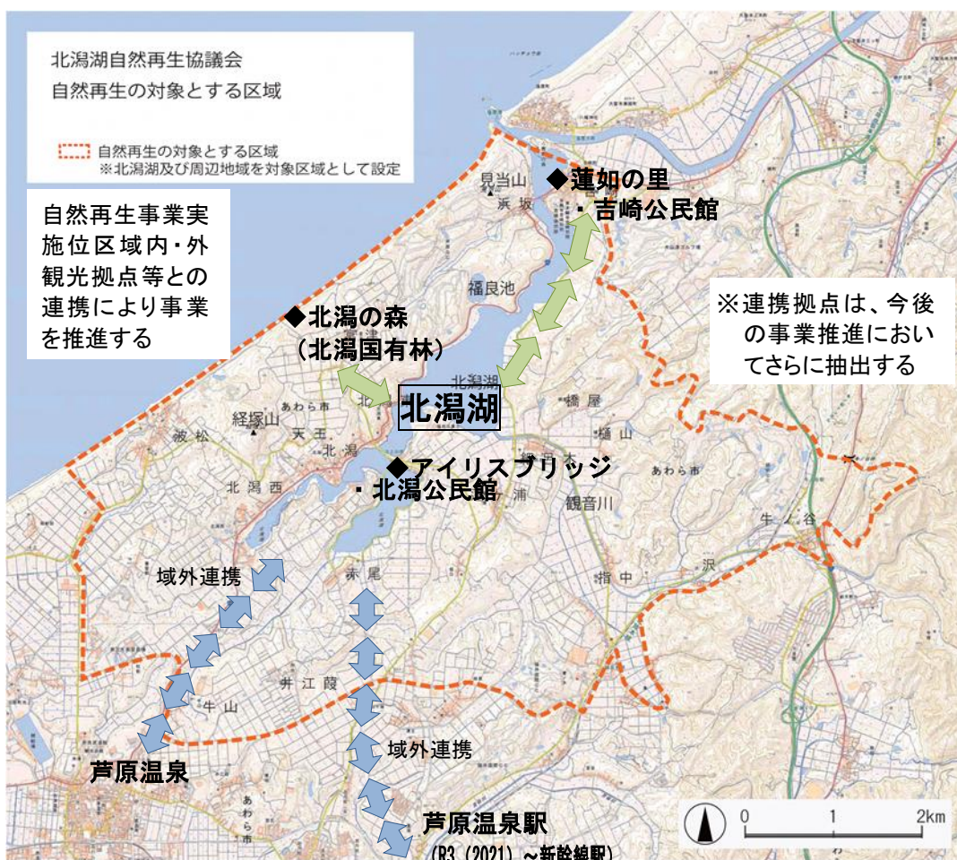
湖の新たな活用と地域経済への貢献事業実施位置