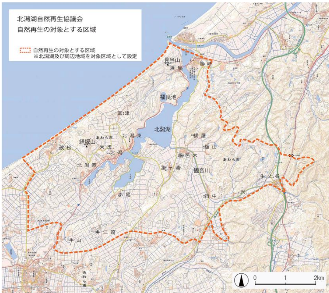
図 自然再生の対象とする区域

北潟湖流域及びその周辺地域（北潟湖の集水域や、地域のつながりなどを考慮しながら設定）