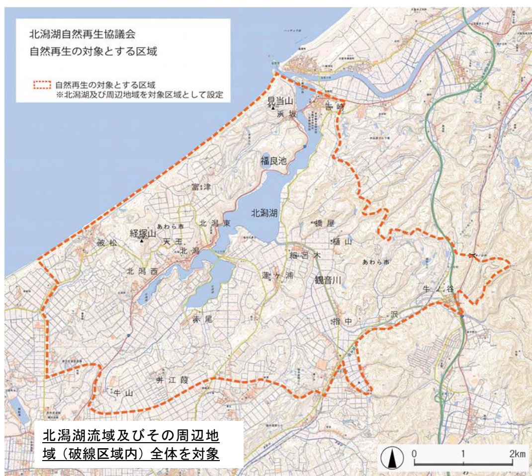
図 北潟湖の水質改善事業実施位置