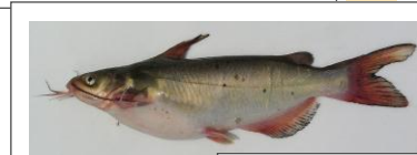
チャネルキャット▲ フィッシュ