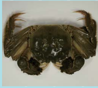
外国産モクズカニのなかま

原産地 朝鮮半島西岸 ~中国沿岸部 日本に 入った理由 食材として 輸入された 別名 きたまま飯