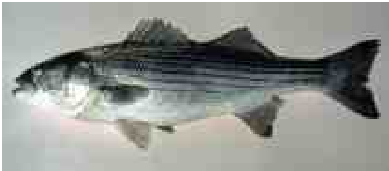
ストライプトバス M. saxatilis